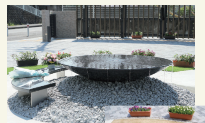
鎮魂のモニュメント

平成28年7月26日、津久井やまゆり園で19名の利用者の方の尊い命が奪われ、27名の方が傷つけられるという、あってはならない悲惨な事件が発生しました。津久井やまゆり園の正門前の広場には、事件で亡くなられた方々を追悼し、事件を風化させないため、神奈川県によって「鎮魂のモニュメント」が設置されています。 かながわ共同会は、この事件を法人運営の貴重な教訓としてしっかりと引き継ぐとともに、毎月26日の「法人祈りの日」には、各園や各事業所において、亡くなられた方々の在りし日の姿に思いを馳せ、その冥福を祈るため、黙とうを捧げています。